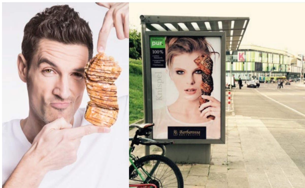
Das perfekte Zusammenspiel zwischen Model und Produkt: Unsere neue Kampagne sorgt für Gesprächsstoff.

Neue Imagekampagne lenkt den Blick auf das Wesentliche