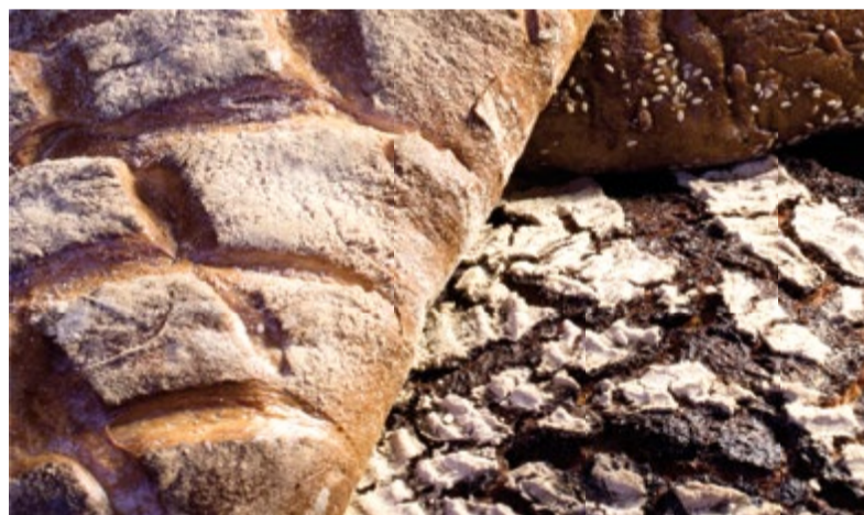
Überschüssige Backwaren werden von uns nach Ladenschluss sinnvoll verteilt.

Eine Frage, die viele unserer Kunden beschäftigt: Was passiert eigentlich mit den Backwaren, die nicht verkauft werden? Ein ausgeklügeltes System sorgt dafür, dass Brote, Brötchen und süße Teile dankbare Abnehmer finden.