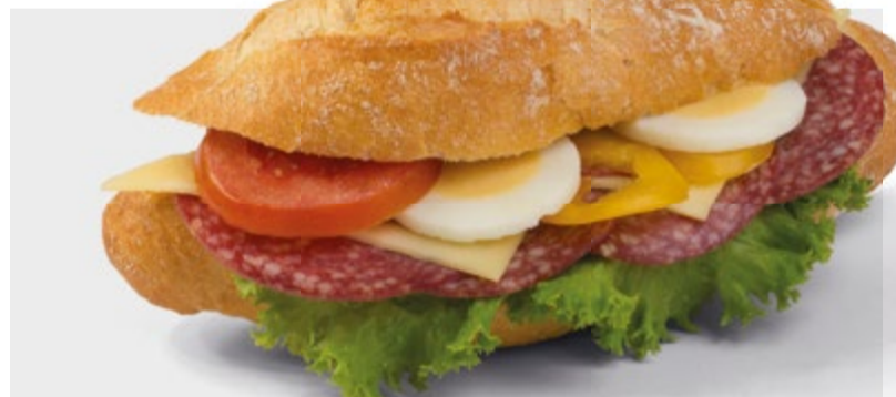
Unser beliebtester Snack – das leckere Salami-Käse-Sandwich.

Das Besondere an unseren Snacks: Sie werden ganz frisch vor Ort belegt. Das Angebot reicht dabei vom klassischen Weizenbrötchen, dem beliebten Roggenbrot und körnigen Brötchen bis hin zum kleinen Ciabatta mit Oliven. Die Zutaten kommen frisch aus der Region, bei den Wurst- und Fleischwaren setzen wir auf die hohe Qualität der traditionsreichen Metzgerei Schwamm aus Saarbrücken. Übrigens: Unser beliebtester Snack ist derzeit das klassische Salami-Käse-Sandwich.