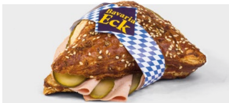
Ein Klassiker in unserem Snack-Angebot ist das Bavaria-Eck: Die Laugen-Ecke ist garniert mit Fleischkäse, Essiggurke und Senfaustrich.